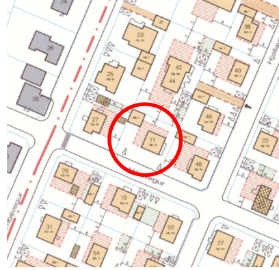
Hluti gildandi deiliskipulags, 1988.