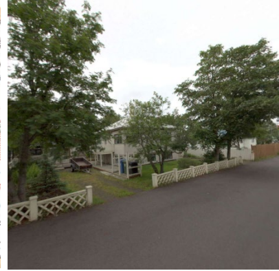
Skjáskot af ja.is, 2023.