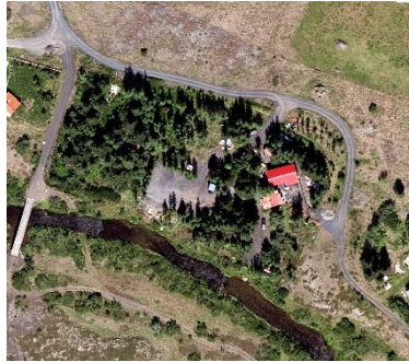
Loftmynd af svæðinu