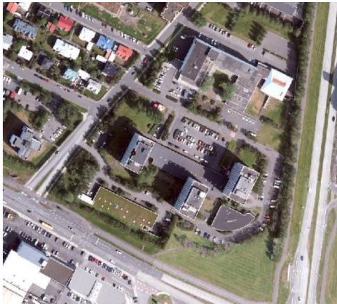
Loftmynd úr Borgarvefsjá

Á embættisafgreiðslufundi skipulagsfulltrúa 18. apríl 2024 var lögð fram fyrirspurn Sævars Sigurðssonar, dags. 9. apríl 2024, ásamt bréfi, ódags., um að setja niður djúpgáma á lóðinni nr. 10 við Hátún, samkvæmt uppdr. Arkitekta, dags. 14. mars 2024. Fyrirspurninni var vísað til umsagnar verkefnastjóra og er nú lögð fram að nýju ásamt umsögn skipulagsfulltrúa dags. 26. apríl 2024.