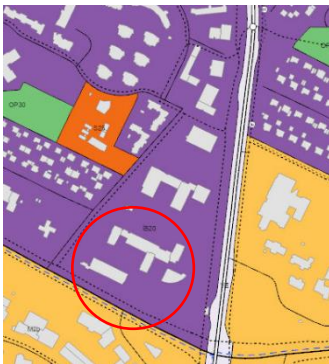
Aðalskipulag Reykjavíkur 2040.

Á embættisafgreiðslufundi skipulagsfulltrúa 13. júní 2024 var lögð fram umsókn Sævars Sigurðssonar, dags. 8. maí 2024, ásamt bréfi, ódags., um breytingu á deiliskipulagi Hátúns 10-14 vegna lóðarinnar nr. 10 við Hátún. Í breytingunni sem lögð er til felst að setja djúpgáma á lóð fyrir íbúa að Hátúni 10, 10A og 10B, samkvæmt uppdr. Arkitekta, dags. 14. mars 2024. Erindinu var vísað til meðferðar verkefnastjóra og er nú lagt fram að nýju.