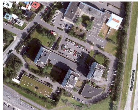
Lofthmynd frá Borgarvefsjá.