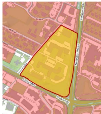
Deiliskipulag Hátúns 10-14.