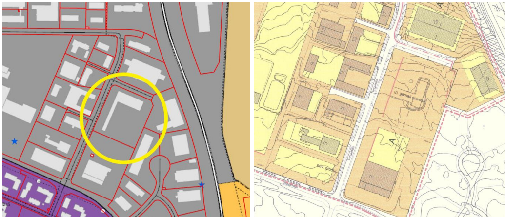
Landnotkun skv. aðalskipulagi Reykjavíkur 2040. Hluti gildandi deiliskipulags.

Lögð fram fyrirspurn Teiknistofunnar Storð ehf., dags. 5. febrúar 2024, ásamt bréfi, dags. 5. febrúar 2024, um breytingu á deiliskipulagi Hálsahverfis vegna lóðarinnar nr. 6 við Tunguháls sem felst í nýrri tengingu inn á lóðina frá Tunguhálsi, samkvæmt uppdr. Teiknistofunnar Storð, dags. 3. og 5. febrúar 2024. Einnig er spurt um skilgreiningu á 1. hæð sem snýr að Tunguhálsi sem aðkomuhæð og hámarks byggingarhæð.