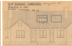
Kvistur í sömu húsaröð, stækkun yrði sambærileg