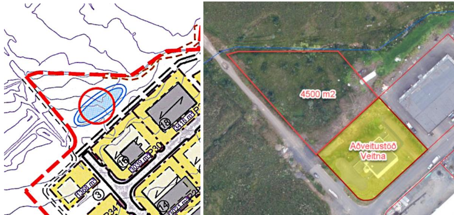
Settjörn í deiliskipulagi.

Fyrirspurnin varðar breytingu á deiliskipulagi Esjumela vegna lóðarinnar nr. 16 við Gullsléttu sem felst í að stækka lóðina um 4500 m 2 til norðvesturs. Gullslétta 16 er staðsett við norðvesturjaðar deiliskipulagssvæðisins, sunnan við eina ef þremur settjörnum skipulagsins.