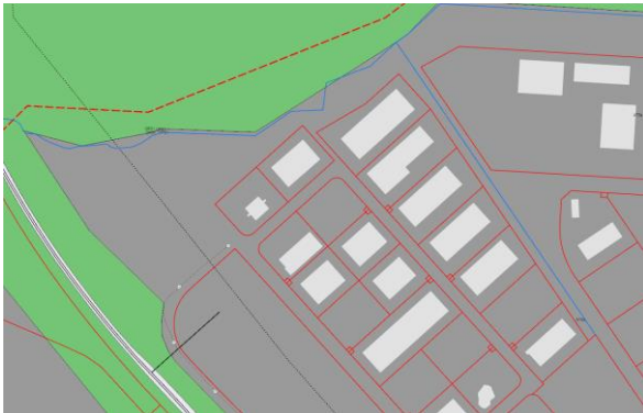
Hluti AR 2040

Lögð fram fyrirspurn Veitna ohf., dags. 23. júní 2023, um stækkun á lóð nr. 16 við Gullsléttu. Einnig lögð fram loftmynd/tillaga ódags.