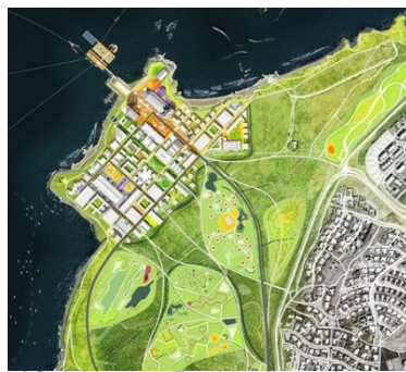
Aðalskipulag Reykjavíkur 2040 Loftmynd