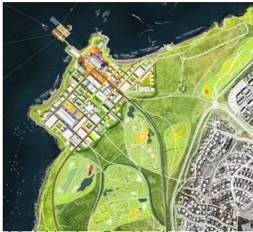
Aðalskipulag Reykjavíkur 2040 Loftmynd