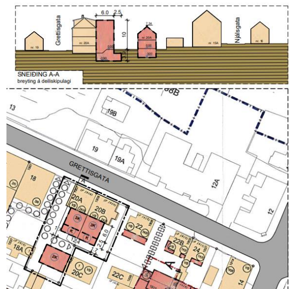
Hluti nýsamþykkt deiliskipulags fyrir lóðirnar