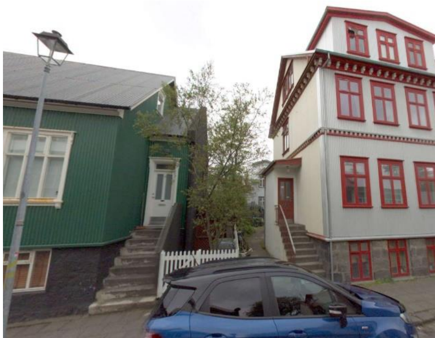
Götumynd sem sýnir bil milli húsa að Grettisgötu 22 og 20B

Varðandi Grettisgötu 20B þá er ekki heimild fyrir viðbyggingu á gafli húss þar sem það þrengir verulega að bili milli húsa og hefur í för með sér breytingu á götumynd. Fyrirliggjandi aðalteikningar sýna enn fremur meira byggingarmagn og hærra nýtingarhlutfall en heimilt er skv. nýsamþykktu deiliskipulagi.