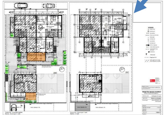
Grettisgata 20B – viðbygging á gaffi