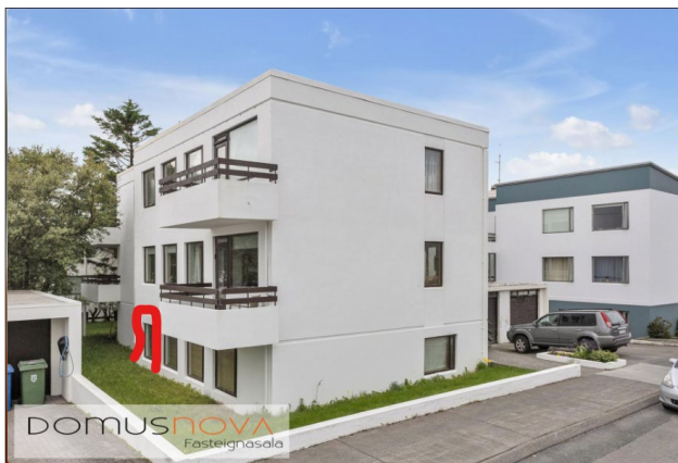
Fyrirhuguð staðsetning nýs inngangs