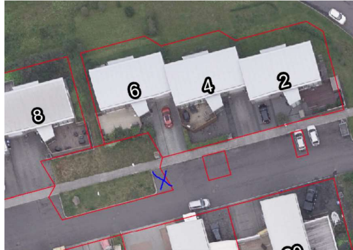
Skissuteikning sem fylgir erindi

Skoðuð er fyrirspurn Kjartans Odds Þorbergssonar, dags. 26.03.2023, um hvort sérmerkja megi svæði á borgarlandi sem bílastæði fyrir hús nr. 6 á lóð nr. 2-6 við Grænlandsleið.