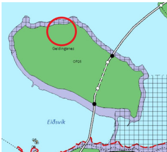
Hluti aðalskipulags Reykjavíkur 2040.

Lögð fram umsókn Sveinbjörns Hólmgeirssonar f.h. Veitna ohf., dags. 3. maí 2024, um framkvæmdaleyfi vegna borunar á nýrri rannsóknarholu á Geldingarnesi og bráðabirgða vatnslögn vegna borframkvæmda. Einnig eru lagðar fram yfirlitsmyndir sem sýna staðsetningu rannsóknarborhola og bráðabirgða vatnslögn.