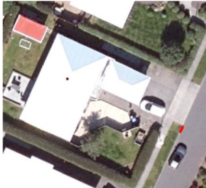
Skyssumynd af fyrirhugaðri breytingu

Skoðuð er fyrirspurn Halldóru Þuríðar Halldórsdóttur, dags. 30. júní 2023, um að fjarlægja kantstein gangstéttar, breikka innkeyrslu og fjölga bílastæðum á lóð nr. 159 við Fannafold, skv. meðfylgjandi skissumynd.