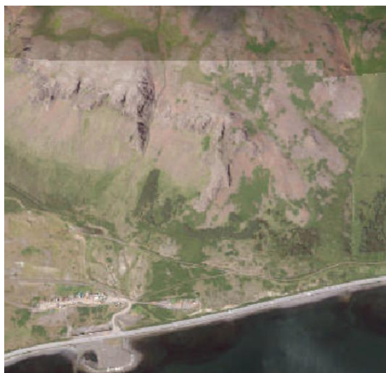
Loftmynd dags. 20.07.2022.