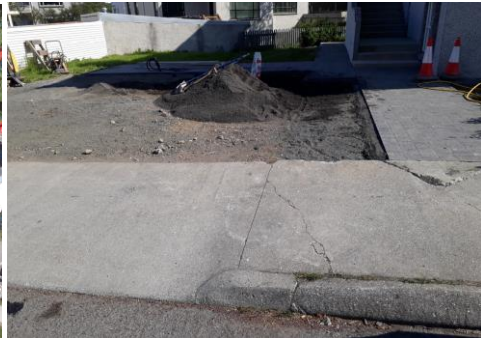
Ljósmynd af bílastæðinu sem fylgdi með fyrirspurn