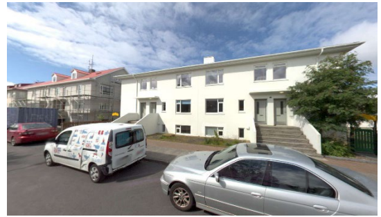
Engihlíð 6-8 (skjáskot af ja.is)