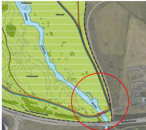
Hluti af gildandi deiliskipulagi, samþykkt 15. desember 2020