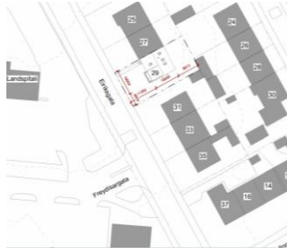
Afstöðumynd og snið B-B skv. uppdráttum dags. 11.07.2024