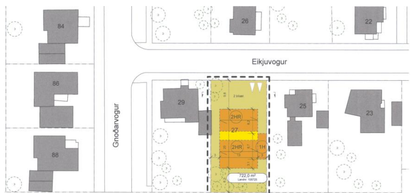
Hluti gildandi deiliskipulags