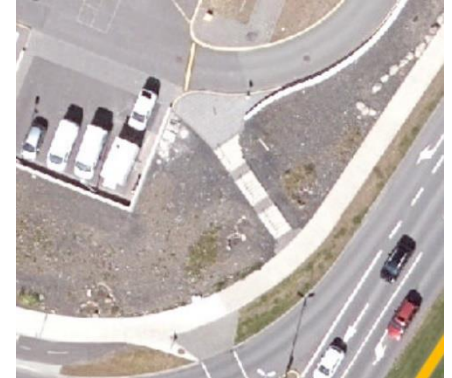
Mynd 3. Loftmynd af stiga á suðausturhorni lóðarinnar