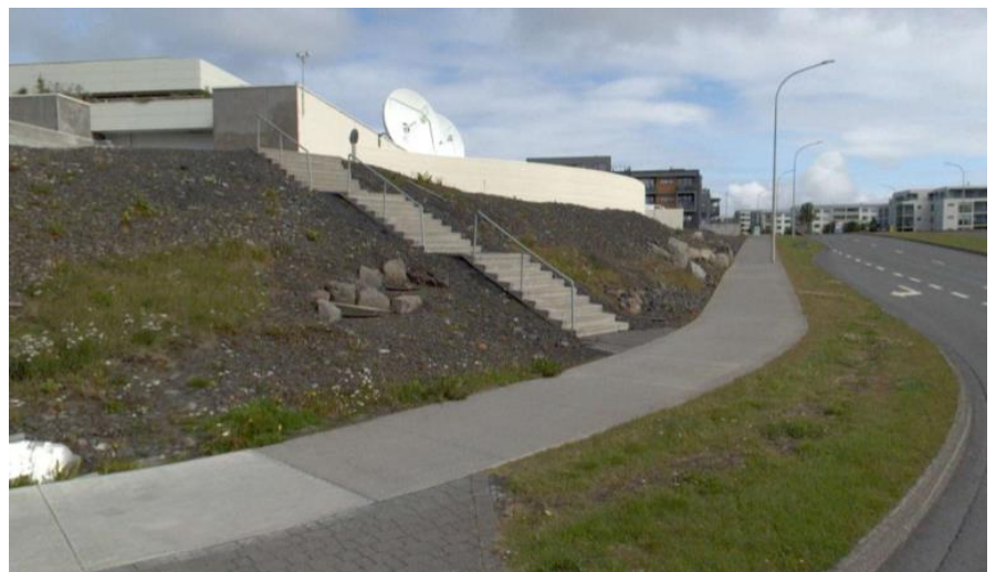
Mynd 4. Stigi á suðausturhorni lóðarinnar, mynd tekin af ja.is þann 26. júlí 2023

Á lóðinni er húsnæði Ríkisútvarpsins og Þjónustumiðstöðvar Laugadals – og Háaleitis. Á lóðinni er einnig að finna stórt bílastæði bæði vestan- og austanmegin við húsið að Efstaleiti 1. Á svæðinu hefur á undanförunum árum verið mikil uppbygging íbúðablokka, þar af nokkrar þar sem þjónusturými er að finna á jarðhæð. Byggt á svæðinu er því nokkuð þétt og mikið líf á svæðinu. Tvær fjölfarnar umferðagötur, sem teljast til áhrifasvæðis Borgarlínu, liggja nálægt svæðinu. Bústaðavegur í suðri og Háaleitisbraut í austri.