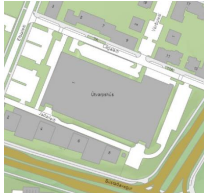
Mynd 2. Kort af svæðinu