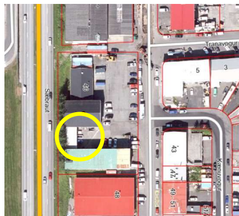
Afstöðumynd af lóð