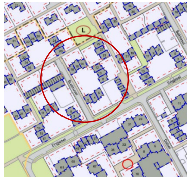
Hverfisskipulag, skilmálaeiningin 13