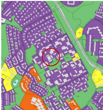
Aðalskipulag Reykjavíkur 2040

Á embættisafgreiðslufundi skipulagsfulltrúa 2. nóvember 2023 var lögð fram fyrirspurn Brekkusels 2-18 húsfélags, dags. 26. október 2023, um að merkja aðkomu sjúkra- og slökkvilið að lóð nr. 2-18 við Brekkusel. Fyrirspurninni var vísað til umsagnar verkefnastjóra og er nú lögð fram að nýju ásamt umsögn skipulagsfulltrúa dags. 07. Desember 2023.