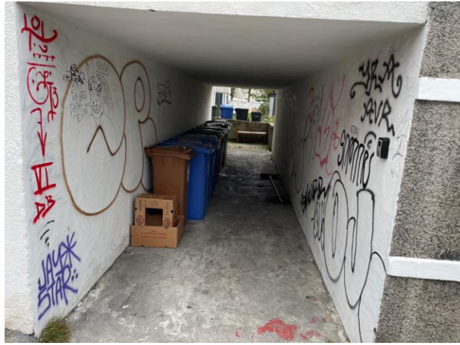
Mynd með fyrirspurn