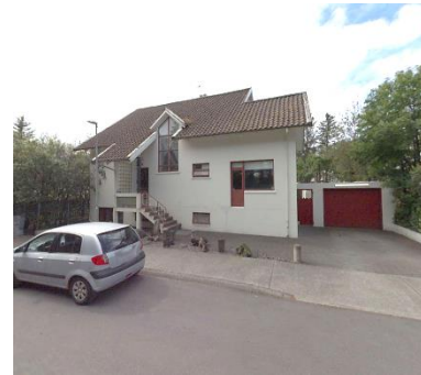
Götumynd, af ja.is (tekin 2022).