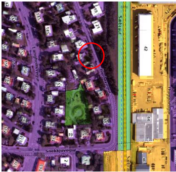
Aðalskipulag Reykjavíkur 2040.

Á embættisafgreiðslufundi skipulagsfulltrúa 6. júní 2024 var lögð fram fyrirspurn A ehf., dags. 3. júní 2024, samt greinargerð, dags. 3. júní 2024, um fjölgun íbúða í húsinu á lóð nr. 36 við Barðavog sem felst í að gera að gera séríbúð á jarðhæð/kjallara hússins. Fyrirspurninni var vísað til umsagnar verkefnastjóra og er nú lögð fram að nýju ásamt umsögn skipulagsfulltrúa, dags. 4. júlí, 2024.