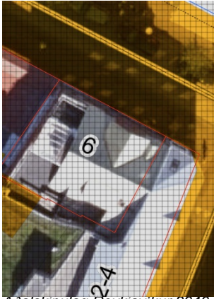
Aðalskipulag Reykjavíkur 2040 Deiliskipulag

Lögð fram fyrirspurn Edward Louis Haines, dags. 23. október 2024, um að mála auglýsingu á hlið hússins á lóð nr. 6 við Bankastræti eða setja upp auglýsingarskilti á hlið hússins.