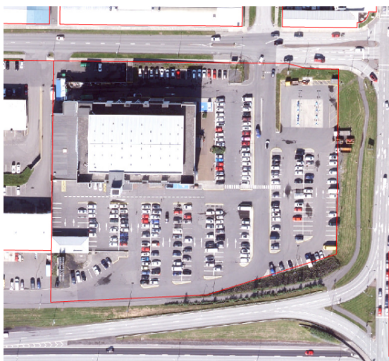
Loftmynd (ágúst 2024)

Skipulagsfulltrúi gerir ekki athugasemd við að gerð sé ný skábraut í kjallara í framangreindum tilgangi en breyta þarf gildandi deiliskipulagi til þess að skilgreina hana, breyta heimildinni fyrir flettiskilti (ýmist taka út eða finna nýja staðsetningu sem meta þarf) og gera grein fyrir öðrum breytingum sem erindið kann að hafa á gildandi skilmála. Æskilegt er að tækifærið sé nýtt til þess að endurskoða bílastæðaskilmála í samræmi við gildandi bíla- og hjólastæðastefnu Reykjavíkurborgar. Virða þarf núverandi kvöð um almenna umferð meðfram suðurhluta lóðar.