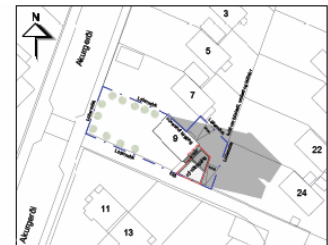
JAFNDÆGUR KL 17 - Eftir breytingu mkv: 1 : 500