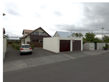
Götumynd, Þjórsárgata 9A