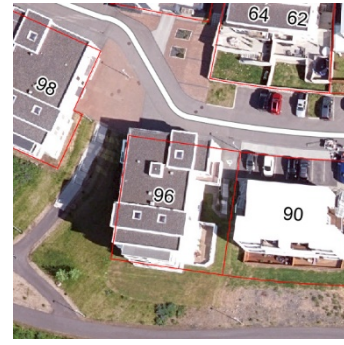
Loftmynd af svæðinu