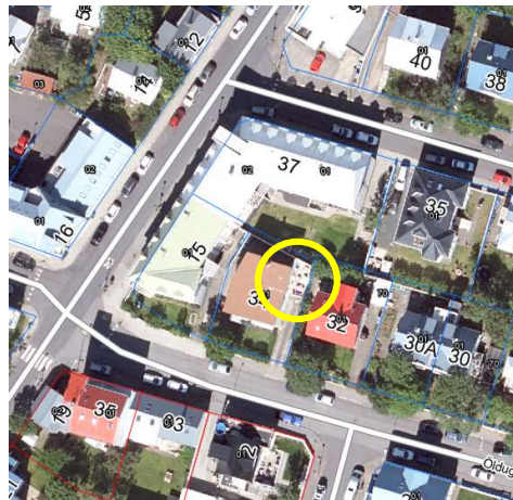
Afstöðumynd af lóð