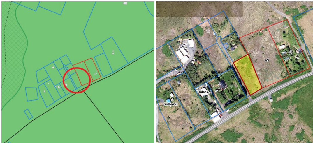
Landnotkun skv. aðalskipulagi Reykjavíkur 2040.

Lögð fram fyrirspurn Sigfúsar Jóhanns Árnasonar, dags. 7. mars 2024, um að reisa sumarhús í Úlfarsfellslandi, landnúmer 186206.