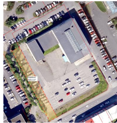
Skýringamynd með fyrirspurn