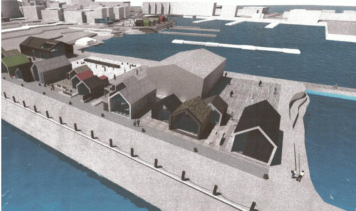
Úr gildandi deiliskipulagi: þrívíddarmynd af fyrirhugaðri uppbyggingu

upphaflega deiliskipulagi, er gert ráð fyrir að svæði 6 verði skipt í 3 lóðir, Ægisgarður 1,5 og 7 þar sem kvóð er um samgöngur á milli lóðar nr. 1 og nr. 7 um norðvesturhluta lóðar nr. 5 við Ægisgarð. Á lóð nr. 5 er gert ráð fyrir húsum fyrir ferðatengda þjónustu, þ.m.t. upplýsingar til ferðamanna og veitingasala, almenningssalarni, geymsluéiningar, skyggni og skjólveggi. Ekki er minnst sérstaklega á húsið á lóð nr. 7 en vísað í eldri skilmála að öðru leyti. Ekki er þó lengur gert ráð fyrir að húsið víki.