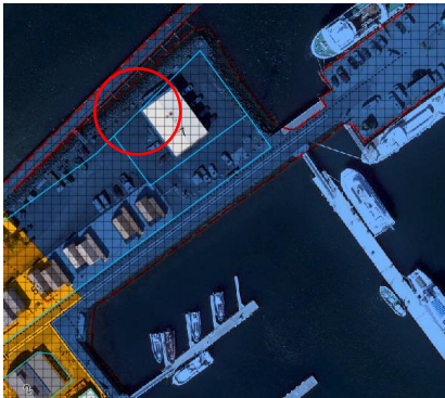
Aðalskipulag Reykjavíkur 2040

Á embættisafgreiðslufundi skipulagsfulltrúa 13. júlí 2023 var lögð fram beiðni Heilbrigðiseftirlits Reykjavíkur, dags. 11. júlí 2023, um umsögn um hvort umsókn Stálsmiðjunnar-Framtak ehf. um endurnýjun á starfsleyfi fyrir starfsemi fyrirtækisins á lóð nr. 7 við Ægisgarð samræmist skipulagi og gildistíma starfsleyfis.