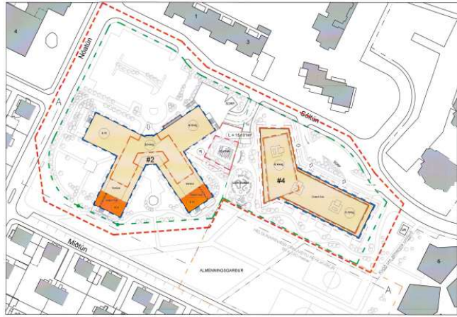
Deiliskipulag í gildi