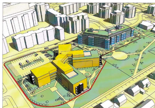
Gróður á lóð skv. gildandi deiliskipulagi