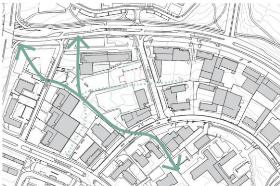
Gönguleiðir skv. tillögu