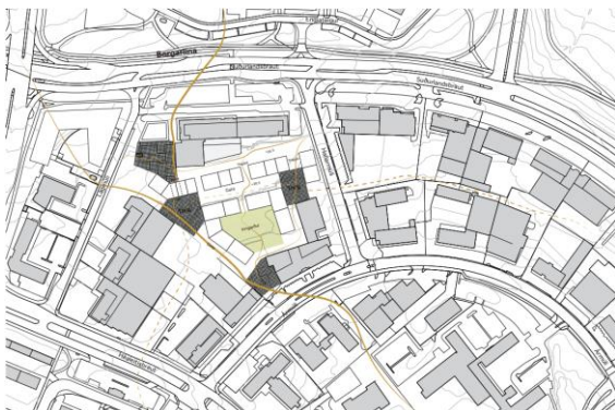
Ný almenningsrymi og tengingar skv. tillögu