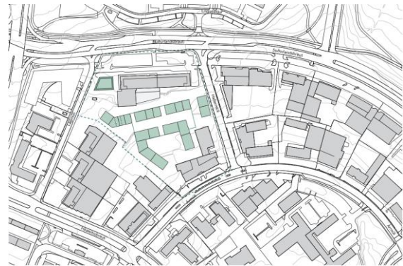
Nýjar byggingar skv. tillögu