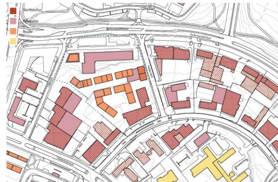
Blönduð byggð skv. tillögu