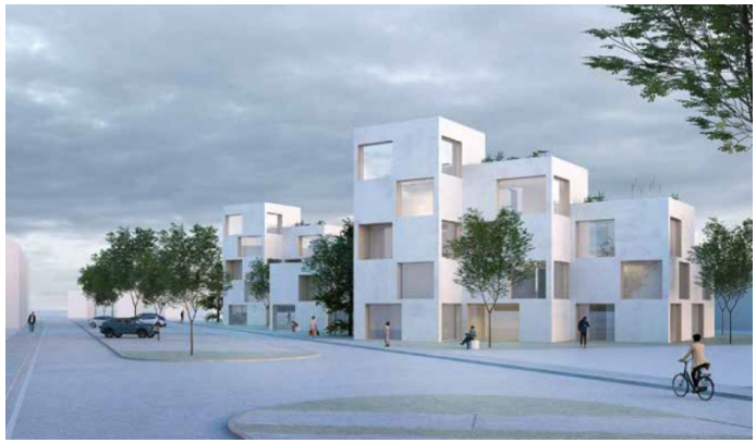
Skýringamyndir sem sýna byggðamynstur og rýmd. Úr tillögu, 2024.

Í deiliskipulagstillögunni er fyrirhugað að atvinnuhúsnæði verði reist syðst á lóðinni og íbúðarhúsnæði nyrst, næst Jöfursbás og með grænu vistvænu belti á milli bygginganna. Með breyttu skipulagi á lóðinni styrkist göturými Jöfursbáss til muna.