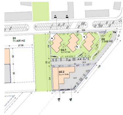
Tillaga að breyttu dsk, Andersen-Sigurðsson