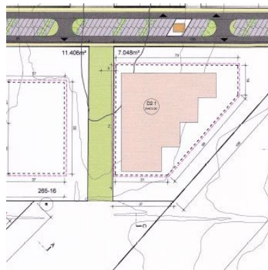
Gildandi deiliskipulag, 2019.