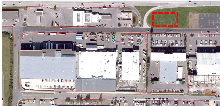
Loftmynd (júlí 2022)