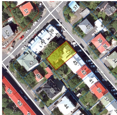
Loftmynd. Ja.is, 2022.