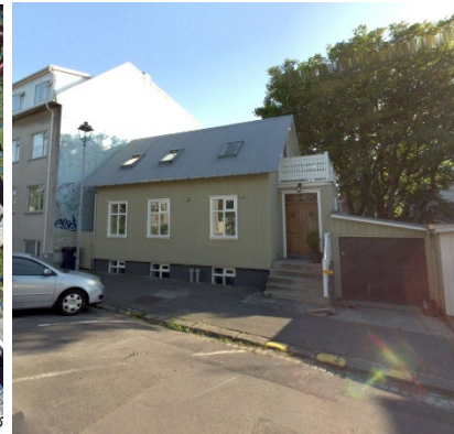
Skjaskot af Sólvallagötu 47.