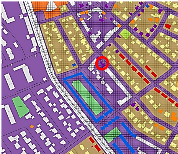
Hluti húsverndarkorts Aðalskipulags Reykjavíkur 2040 – Sólvallagata 47 merkt rauðum hring.

Deiliskipulag/ Hverfisskipulag: Ekki er í gildi deiliskipulag fyrir umrædda lóð. Hverfið er skilgreint sem hverfisverndarsvæði sbr. 6.3.i. gr. í skipulagsreglugerð.