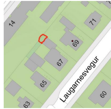
Tillaga af stækkun lóðarinnar nr. 69