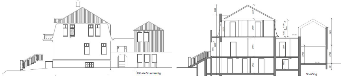
Tillaga viðbyggingar, útlit og sneiðing, Ólöf Flygering 2024.

Óskað er eftir álit skipulagsfulltrúa hvort leyfi fái til að byggja íbúðarhús á gömlum grunni bílskúrs á norður hluta lóðarinnar og hækka í tvær hæðir. Inngangur að íbúðinni yrði um sameiginlegan innigarð frá Grundarstíg. Grunnflötur viðbyggingarinnar er 42 m 2 eða um 84 m 2 í heildina.