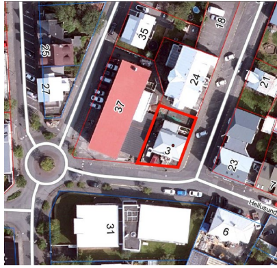
Loftmynd, Borgarvefsjá 2023.