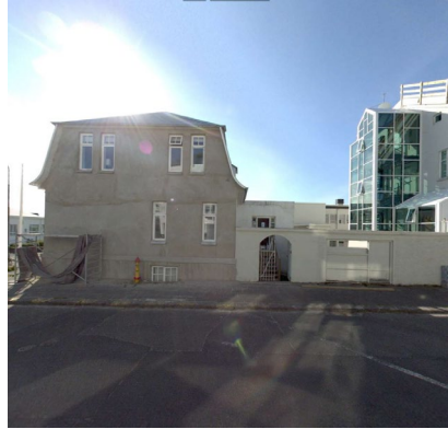
Hellusund 3, skjáskot af ja.is.