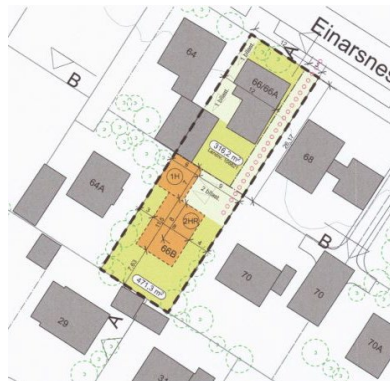
Hluti deiliskipulags í gildi, 2022.