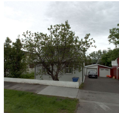
Einarsnes 28, skjáskot af ja.is.