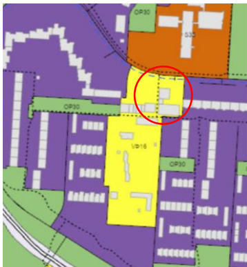
Aðalskipulag Reykjavíkur 2040

Á embættisafgreiðslufundi skipulagsfulltrúa 26. apríl 2024 var lögð fram fyrirspurn Gísla Þrastarsonar, dags. 26. mars 2024, ásamt bréfi Eddufells 2-6, fasteignafélags ehf., dags. 26. mars 2024, um breytingu á notkun 2. hæðar hússins á lóðinni nr. 2-6 við Eddufell úr atvinnuhúsnæði í íbúðarhúsnæði, samkvæmt tillögu Örnú Þorleifsdóttur, ódags. Fyrirspurninni var vísað til umsagnar verkefnastjóra og er nú lögð fram að nýju ásamt umsögn skipulagsfulltrúa dags. 16. maí 2024.