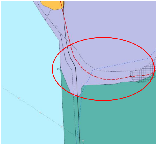
Hluti aðalskipulags Reykjavíkur 2040.

Lögð fram umsókn Elísbetar Rúnarsdóttur f.h. Vegagerðarinnar, dags. 22. apríl 2024, ásamt bréfi Vegagerðarinnar, dags. 19. apríl 2024, um framkvæmdaleyfi vegna vinnu við landfyllingar vegna brúargerðar yfir Fossvog. Einnig lagt fram teikningasett Eflu dags. í apríl 2024, umsögn Hafrannsóknastofnunar, dags. 31. janúar 2024, umsögn Minjastofnunar Íslands, dags. 15. janúar 2024, umsögn Náttúrufræðistofnunar Íslands, dags. 24. janúar 2024, umsögn Umhverfisstofnunar, dags. 16. janúar 2024 og ákvörðun Skipulagsstofnunar um matsskyldu, dags. 30. apríl 2020.