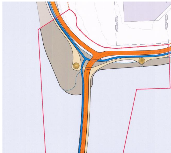
Hluti gildandi deiliskipulags.