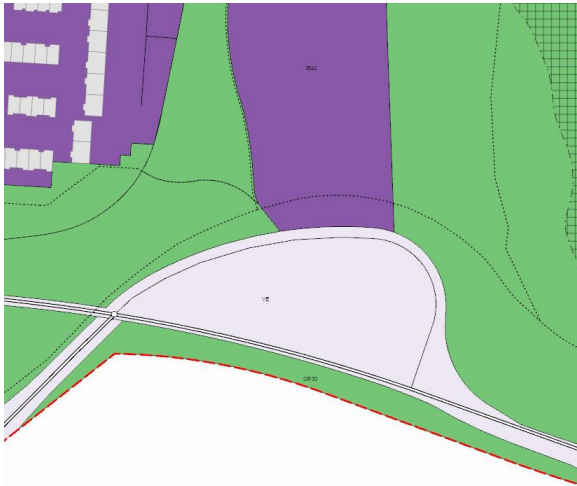
Hluti aðalskipulags Reykjavíkur 2040.

Lagt fram bréf Vegagerðarinnar og Reykjavíkurborgar, dags. 15. apríl 2024, þar sem óskað er eftir uppfærslu framkvæmdaleyfis fyrir Arnarnesveg m.t.t. breytinga á hönnun og nýrra skipulagsmarka. Einnig er lögð fram afstöðumynd, dags. 24. febrúar 2024, yfirlitsmynd framkvæmdar, dags. 7. mars 2024, snið jarðvegsmana dags. 7. mars 2024 og yfirlitsmynd veghelgunarsvæðis dags. 7. mars 2024. Eingöngu er um að ræða breytingu á staðsetningu göngustígs innan þess áfanga sem skilgreindur er sem X6 í gögnum framkvæmdaleyfisins. Breytingin felur í sér að umræddur áfangi nær yfir minna framkvæmdasvæði en þau hönnunargögn sem fylgja útgefnu framkvæmdaleyfi. Annað er óbreytt. Ekki er talin þörf á útgáfu nýrra afnotaleyfa fyrir umrætt svæði.