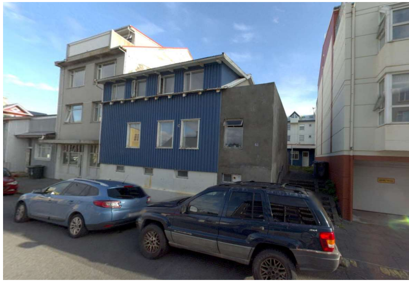
Götumynd (júlí 2022)