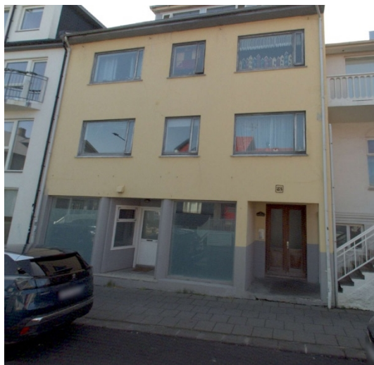
Aðalskipulag Reykjavíkur 2040