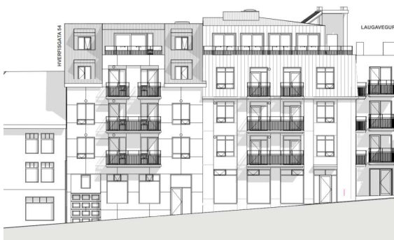
Tillaga 1 að uppdeilingu áklæðningar