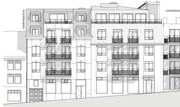
Tillaga 2 að uppdeilingu áklæðningar