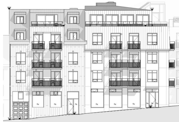
Útlit samkvæmt innsendum aðaluppdráttum