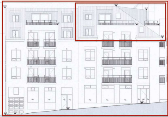
Útlit fyrir breytingu

Skoðuð er breyting á erindi BN059362 Orra Árnasonar, dags. 07.03.2023, sem felst í breytingu á þakformi suðurhluta húss og áklæðningu húsa á lóð nr. 4 við Vatnsstíg. Erindi fylgir tölvupóstur hönnuðar, dags. 29.03.2023, með mismunandi útfærslum á uppdeilingu klæðningar.