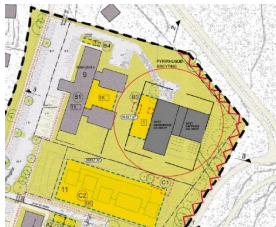
Uppdráttur með fyrirspurn, Stjórnugróf 9

Í gildandi deiliskipulagi er búið að stækka byggingarreit gróðurhúss og innan hans er heimilt að rífa núverandi gróðurhús, stækka það eða byggja nýtt. Í skilmálum er einnig talað um að lóðin er gróin og það skal halda í þann gróður sem fyrir er. Heimilað er að gera hljóðmön við lóðmörk til austust til að bæta hljóðvist á lóðinni því hún liggur við miklar umferðaræðar eins og Reykjanesbraut og Bústaðarveg og áhersla er lögð á góðar tengingar fyrir göngu- og hjólastíg um svæðið.