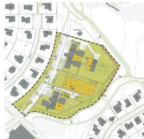
Fossvogshverfi „breyting á deiliskipulagi vegna Stjórnugróf 7,9 og 11“ - 2018