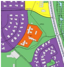
Aðalskipulag Rvk - 2040