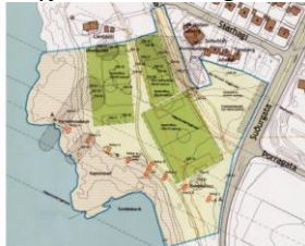
Deiliskipulag Starhaga - aðflugsljós fyrir Reykjavíkurlugvöll